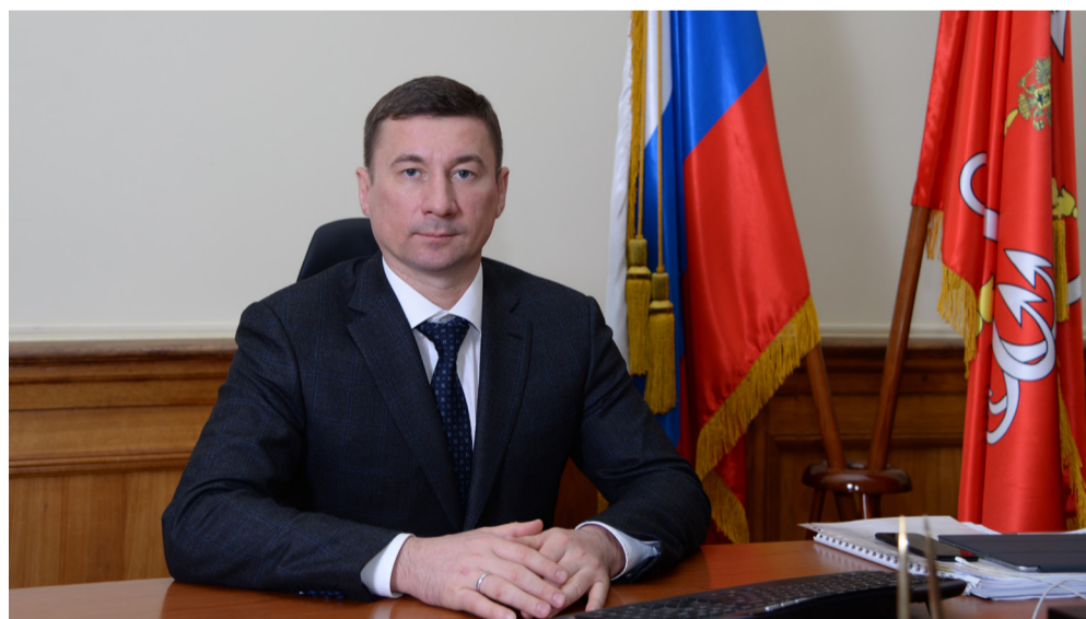
Глава администрации Петроградского района И.А. Громов