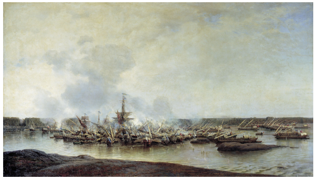
«Сражение при Гангуте 27 июля 1714 года». Алексей Боголюбов, 1876 год.

9 августа – День победы в Гангутском сражении (1714) 10 августа – День физкультурника 11 августа – День строителя 12 августа – Международный день молодежи, День ВВС 13 августа – Международный день левшей 15 августа – День археолога 18 августа – День авиации 19 августа – День тельняшки 20 августа – День флага 23 августа – День победы советских войск в Курской битве (1943) 25 августа – День шахтера 27 августа – День кино