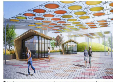
Спокойная зона отдыха и детская площадка с игровой и спортивной инфраструктурой. Под навесом расположен зона общественного питания с палаточной кафе.