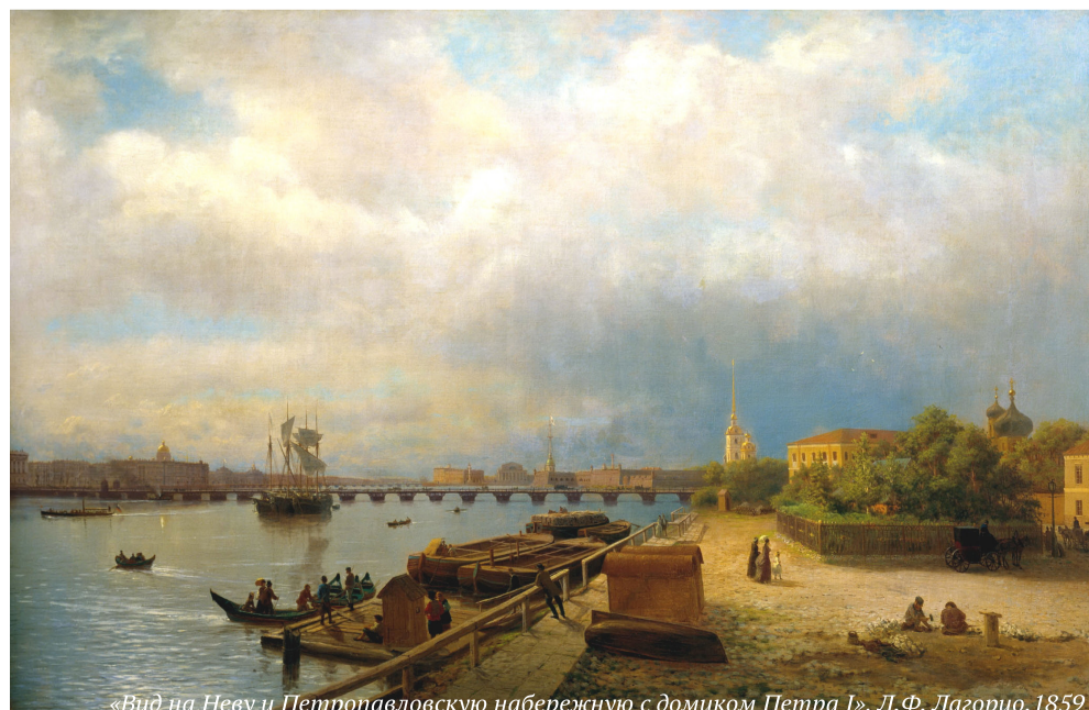
«Вид на Неву и Петропавловскую набережную с домиком Петра I», Л.Ф. Лагорио, 1859

Представитель старинного шотландского рода Яков Вилимович Брюс с детства пристрастился к математическим и естественным наукам, которыми не переставал заниматься всю жизнь, заслужив у плохо образованной публики репутацию «чернокнижника и мага». Но Брюс был не только талантливым ученым-самоучкой. Один из ближайших сподвижников Петра Великого принимал активное участие и в войнах своего времени (например, командовал артиллерией в Полтавской битве), и в