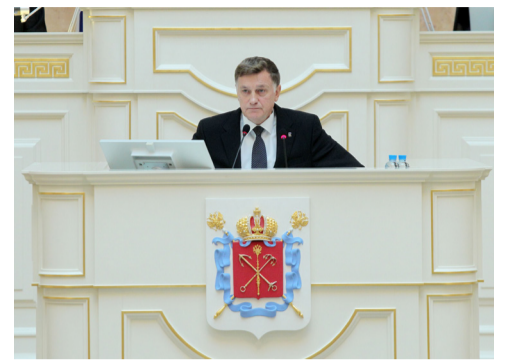
го Собрания Санкт-Петербурга Вячеслав Макаров.

петербуржцами парковую зону от застройки, с другой – оставляем возможности для развития одного из старейших яхт-клубов страны, который также является достоянием города. Морскую столицу России сложно представить себе без водных видов спорта. Наша задача – повышая качество городской среды, сохранить все лучшее, что создано в Санкт-Петербурге за более чем три века его славной истории» – прокомментировал законопроект Председатель Законодательно-