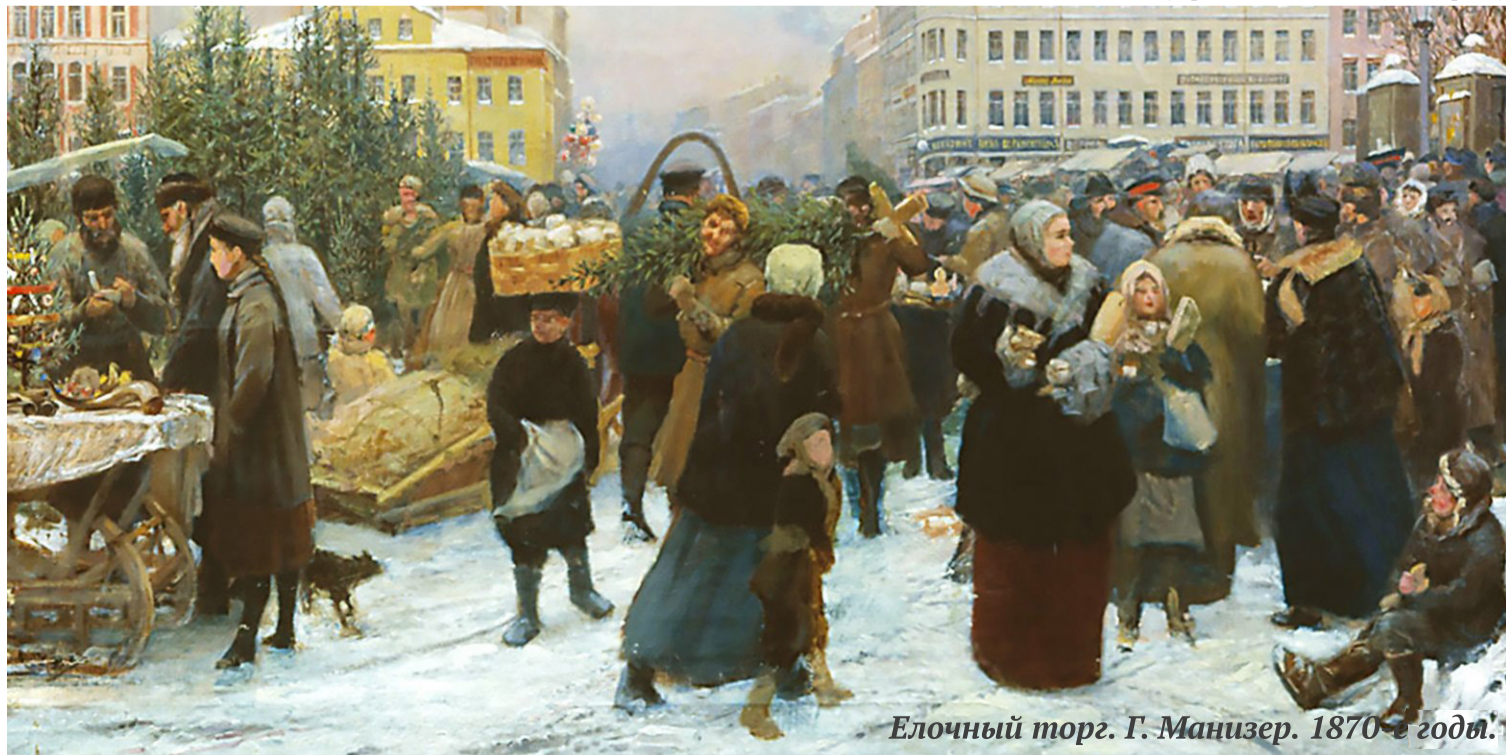
Елочный торг. Г. Манизер. 1870-е годы.