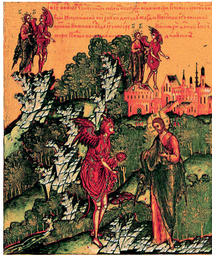
«Искушение Христа» (клеймо иконы Спас Вседержитель, 1682 год)