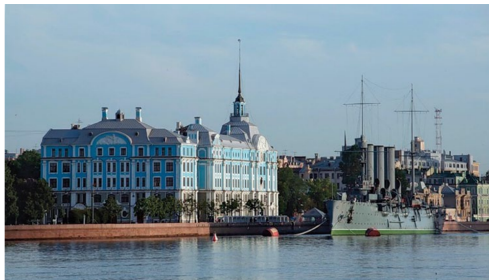
Округ Посадский — муниципальный округ, муниципальное образование, расположенное в центральной части Санкт-Петербурга — Петроградском районе города.