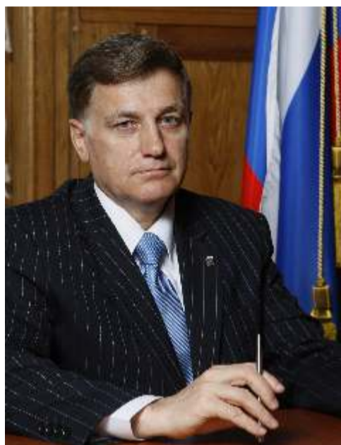
Уважаемые ленинградцы – петербуржцы! Дорогие ветераны, блокадники!

27 января – священная дата для нашего города. В этот день 71 год назад Ленинград был окончательно освобожден от вражеской блокады.