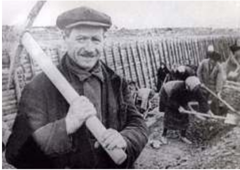
(начало на странице 1)

Советские войска, сражавшиеся в Эстонии оказались рассечёнными на две части: 11 стрелковый корпус с боями начал отходить к Нарве, а 10 корпус - к Таллину. Таллин оставался единственным портом по снабжению и эвакуации советских войск, но город не был подготовлен к обороне с суши. Её пришлось создавать в ходе борьбы: намечалось создать вокруг города три оборонительных рубежа.