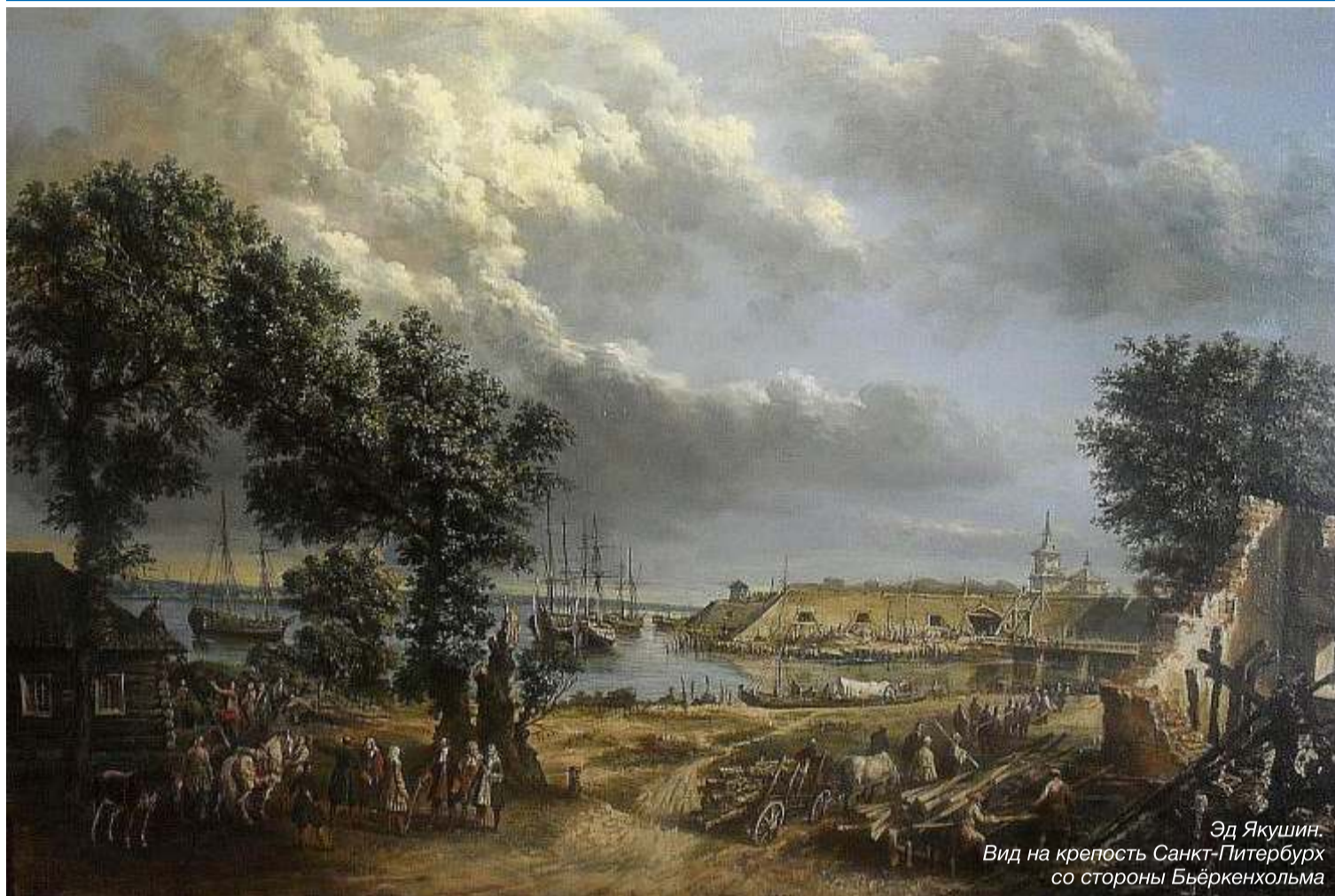
Эд Якушин. Вид на крепость Санкт-Петербург со стороны Бьёркенхольма

Этот факт – стар, как история Петербурга. Новый город начинался с территории нынешнего округа Посадский. Здесь, на берегах Невы расположено самое старое строение – Домик Петра I. В первые десятилетия XVIII века Троицкая площадь являлась административным, торговым и культурным центром Петербурга. Но строилось ли всё это на пустом месте, или кто-то освоил эти "пустые" берега еще до того, как их посетил русский Царь – будущий Император Всероссийский Петр Алексеевич – постараемся разобраться.