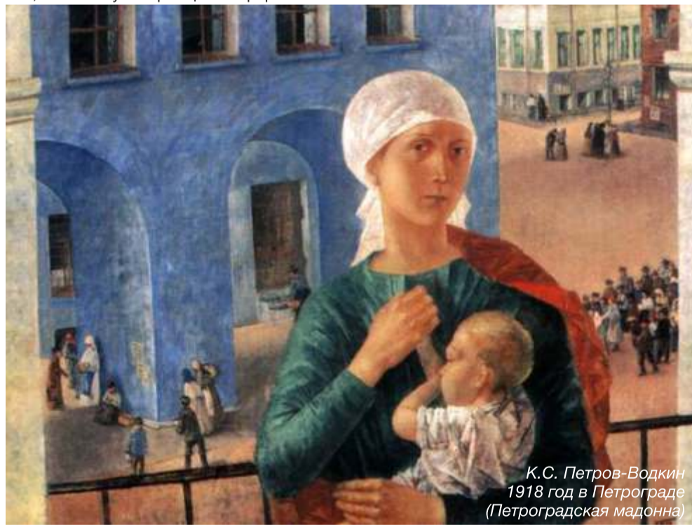
К.С. Петров-Водкин 1918 год в Петрограде (Петроградская мадонна)