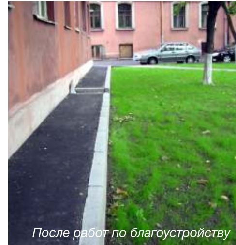
После работ по благоустройству