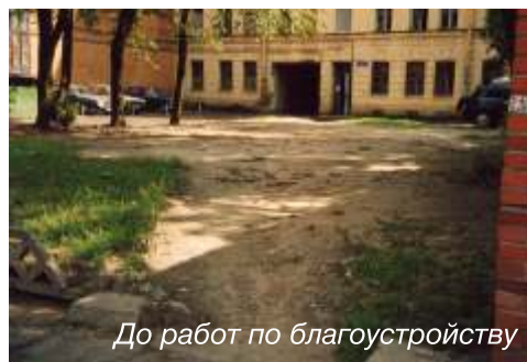
До работ по благоустройству