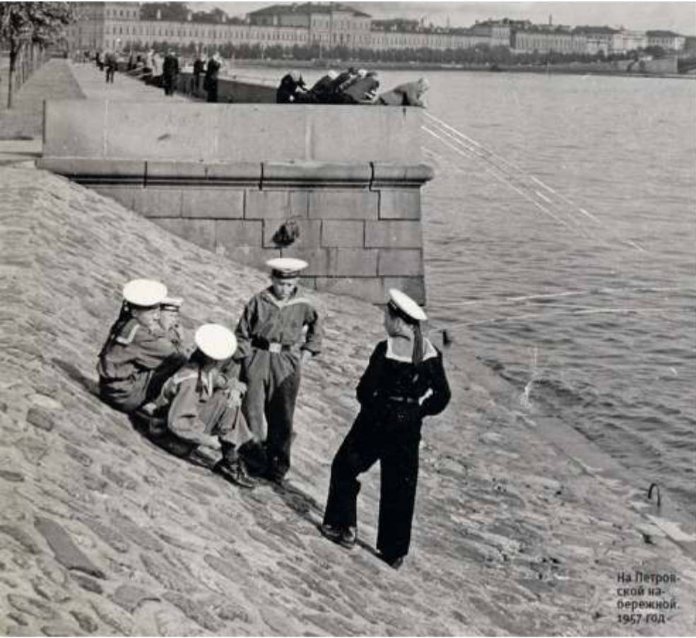
На Петровской набережной. 1957 год.

боевыми наградами. Первый начальник училища, выбравший в Ленинграде подходящее для училища здание, остановился на бывшем Училищном доме Петра Великого.