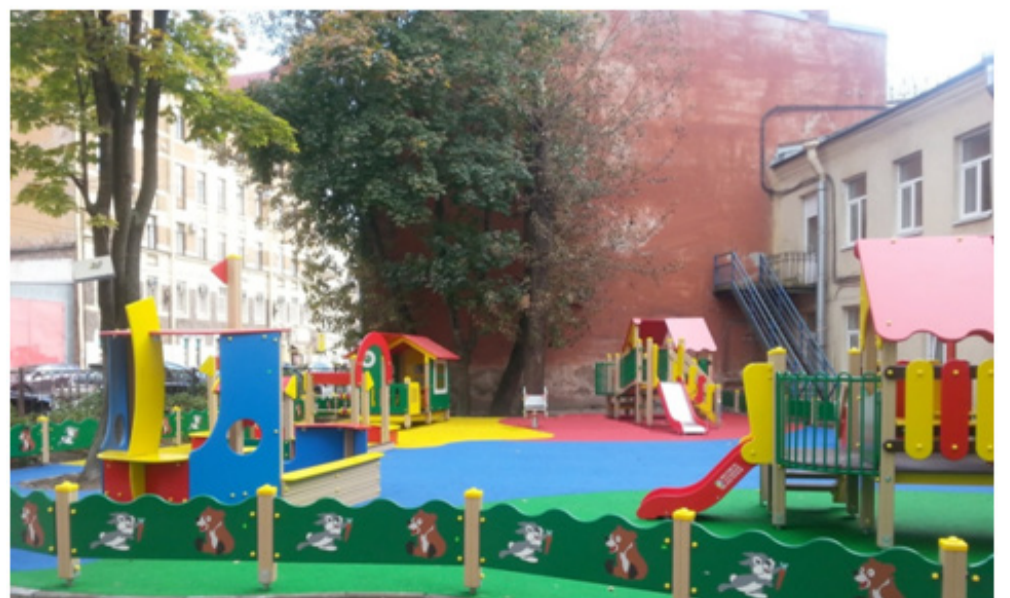
Большой проспект П.С., д. 9/1 до благоустройства (сверху) и после (снизу)