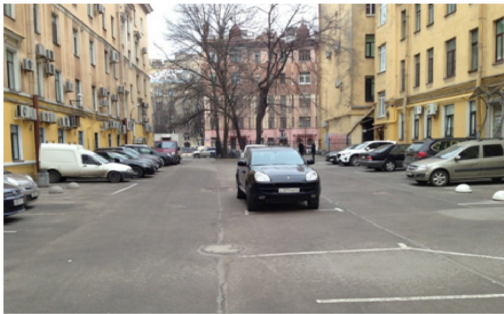
Улица Красного курсанта, дом 5/11 до благоустройства (слева) и после (справа)

Приведу несколько примеров. На улице Профессора Попова, д. 43 и Каменноостровском, д. 62 был проведен комплексный ремонт, установлено игровое и спортивное оборудование. Эти площадки пользуются большой