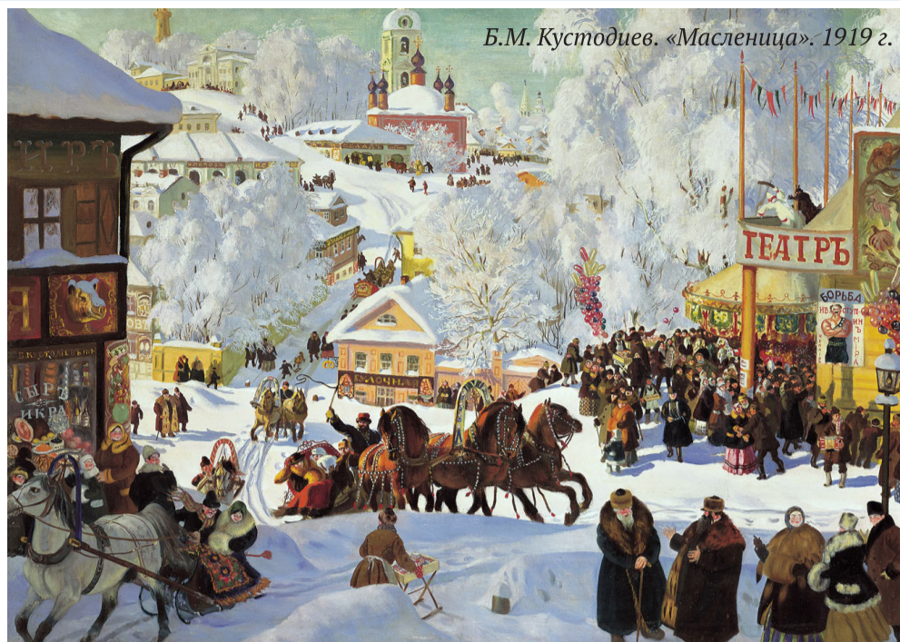
Б.М. Кустодиев. «Масленица». 1919 г.

Первый день праздничной недели именуют «Встречей», раньше в понедельник ходили с чучелом по деревне и строили