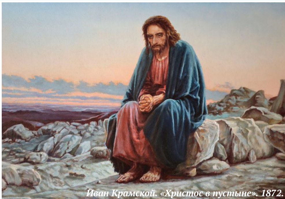
Иван Крамской. «Христос в пустыне». 1872.

Великий пост установлен, главным образом, в память сорокадневного поста Иисуса Христа, который вскоре после Своего крещения удалился в пустыню и постился там (Мф. 4, 2), а также в память сорокадневного поста Моисея (Исх. 34, 28) и Илии (3 Цар. 19, 8). О том, что пост был установлен апостолами и длился сорок дней почти с начала его установления, есть свидетельства с глубокой древности, а само название «Четыредесятница» часто встречается в древних письменных памятниках. Однако, соблюдался пост Святой Четыредесятницы (длвшийся повсюду 40 дней) в древней Церкви не в одно и то же время. Это зависело от неодинакового исчисления дней поста и дней, когда он разрешался. В Восточных Церквях существующий и доныне порядок соблюдения Великого поста установился в