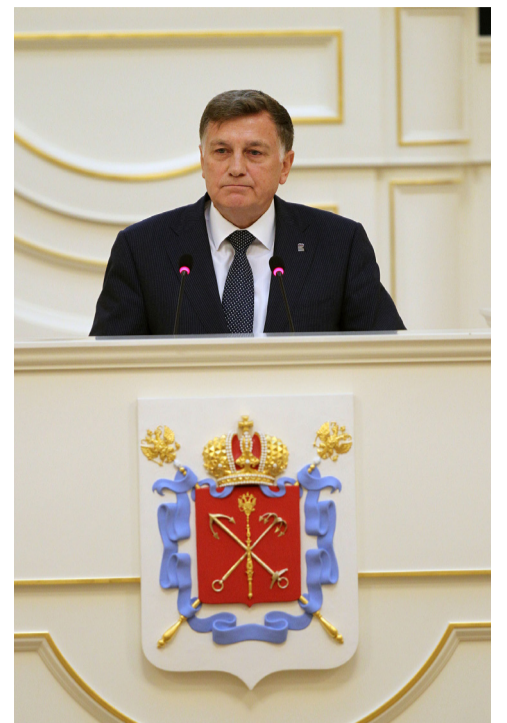
– Прокомментировал Председатель Законодательного Собрания Вячеслав Макаров.

Нам предстоит широкое обсуждение предложенного законопроекта. Уверен, что в ходе конструктивного сотрудничества депутатов, представителей исполнительной власти и экспертного сообщества Санкт-Петербурга город получит крепкий, сбалансированный документ, который позволит дать новый импульс социально-экономическому развитию Северной столицы»